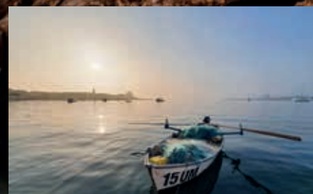
Miroslav Pretula Tradicija, život i riba Tradizione, vita e pesce