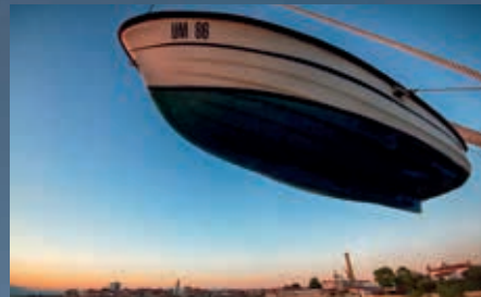
Neven Gerencir NLO grada Umaga UFO umaghese