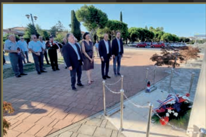
5. 8. 2022. Dan pobjede i domovinske zahvalnosti te Dan hrvatskih branitelja Giornata della vittoria e del ringraziamento nazionale e dei difensori della Guerra Patria