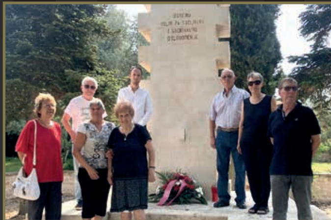
22. 6. 2022. Dan antifašističke borbe - Giornata della lotta antifascista