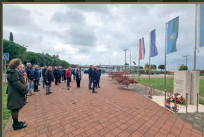
18. 11. 2022. Dan sjećanja na žrtve Domovinskog rata i na žrtvu Vukovara i Škabrnje - Giornata del ricordo delle vittime della Guerra Patria e delle vittime di Vukovar e Škabrnja