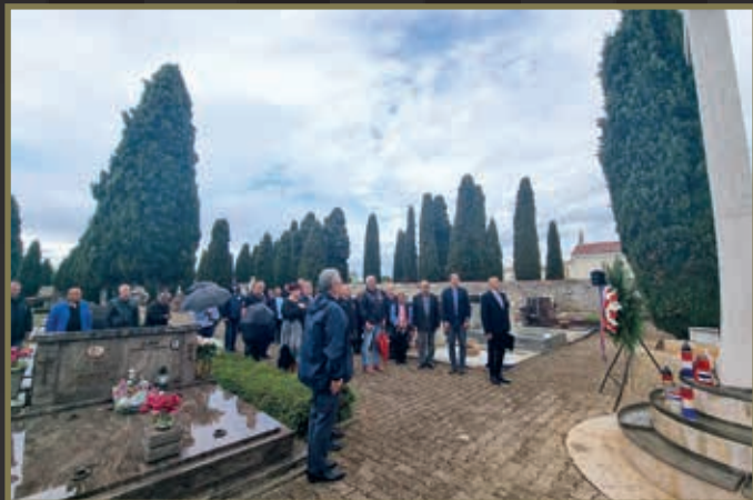
30. 5. 2022. Dan državnosti - Giornata dello Stato