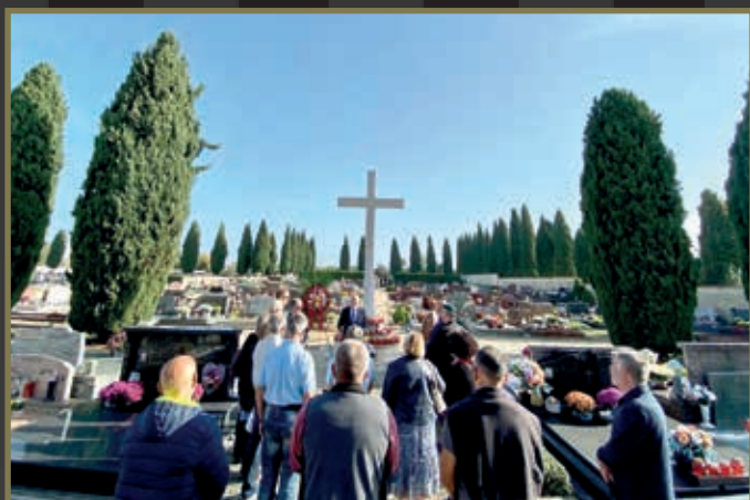
1. 11. 2022. Svi sveti - Ognissanti