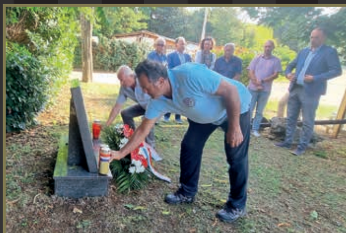
9. 9. 2022. Komemoracija za žrtve parobroda San Marco Commemorazione vittime del San Marco